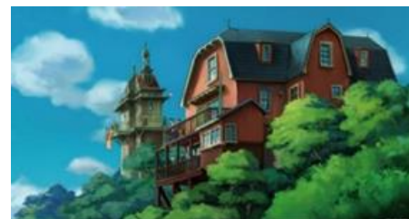
(ジブリパーク「青春の丘エリア」デザイン画)

2022年秋に愛・地球博記念公園(愛知県長久手市)内に開園するスタジオジブリの世界観を表現した公園施設で、5エリアが誕生します。「青春の丘エリア」「ジブリの大倉庫エリア」「どんどこ森エリア」が22年秋に先行オープン。約1年後、「もののけの里エリア」「魔女の谷エリア」がオープンします。