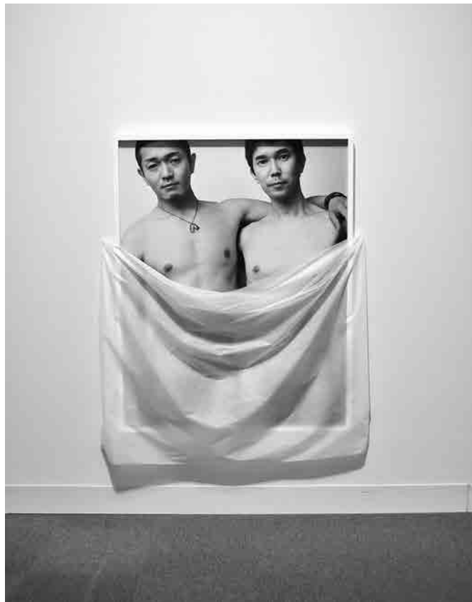
図2：鷹野隆大《おれとwith KJ#2（2007）》（2007年）の展示変更後の写真