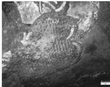
図3. 観察箇所 布2の拡大画像