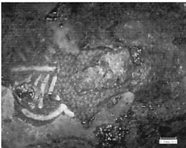
図2. 観察箇所 布1の拡大画像

（なお、布に耳は確認されず経緯糸の区別ができなかったため、便宜的に糸の本数の多い太い糸を経糸とした。）